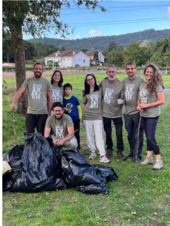
A Estrada- Asoc. Pola Defensa do Val do Liñares