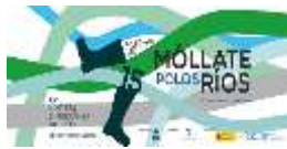
A Guarda- Asoc. A Jalleira