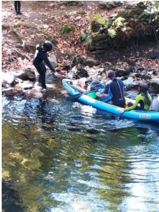
Ames- Aula da Natureza do Concello de Ames