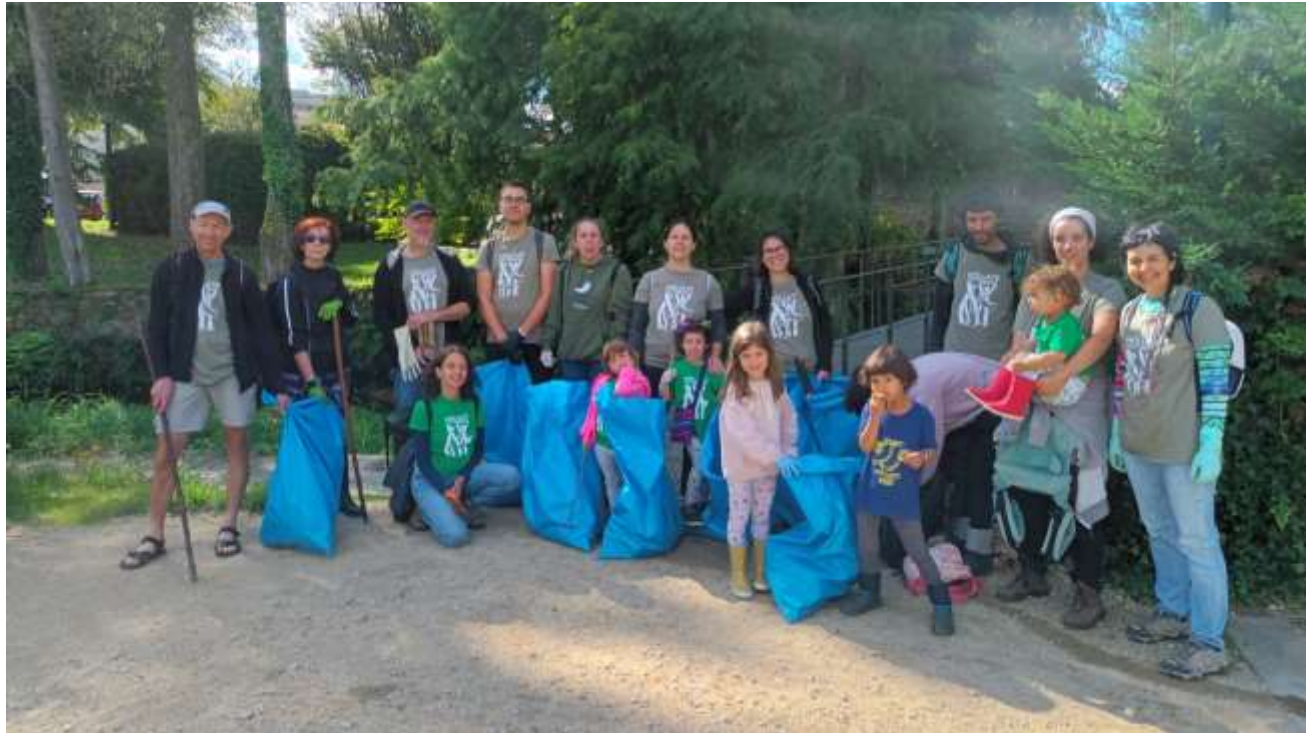
Santiago de Compostela. AFA Montessori