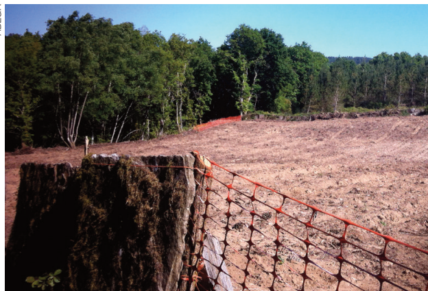
Tala de bosque autóctono no concello de Lugo, que foi denunciada por ADEGA e que resultou finalmente sancionada, evitando a repoboación ilegal con eucaliptos.