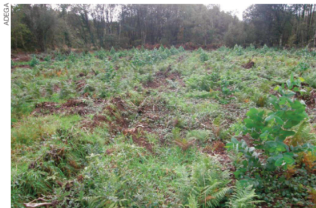
Plantación de eucaliptos realizada tras a tala dunha masa multiespecífica de bosque autóctono, denunciada por ADEGA en Begonte.