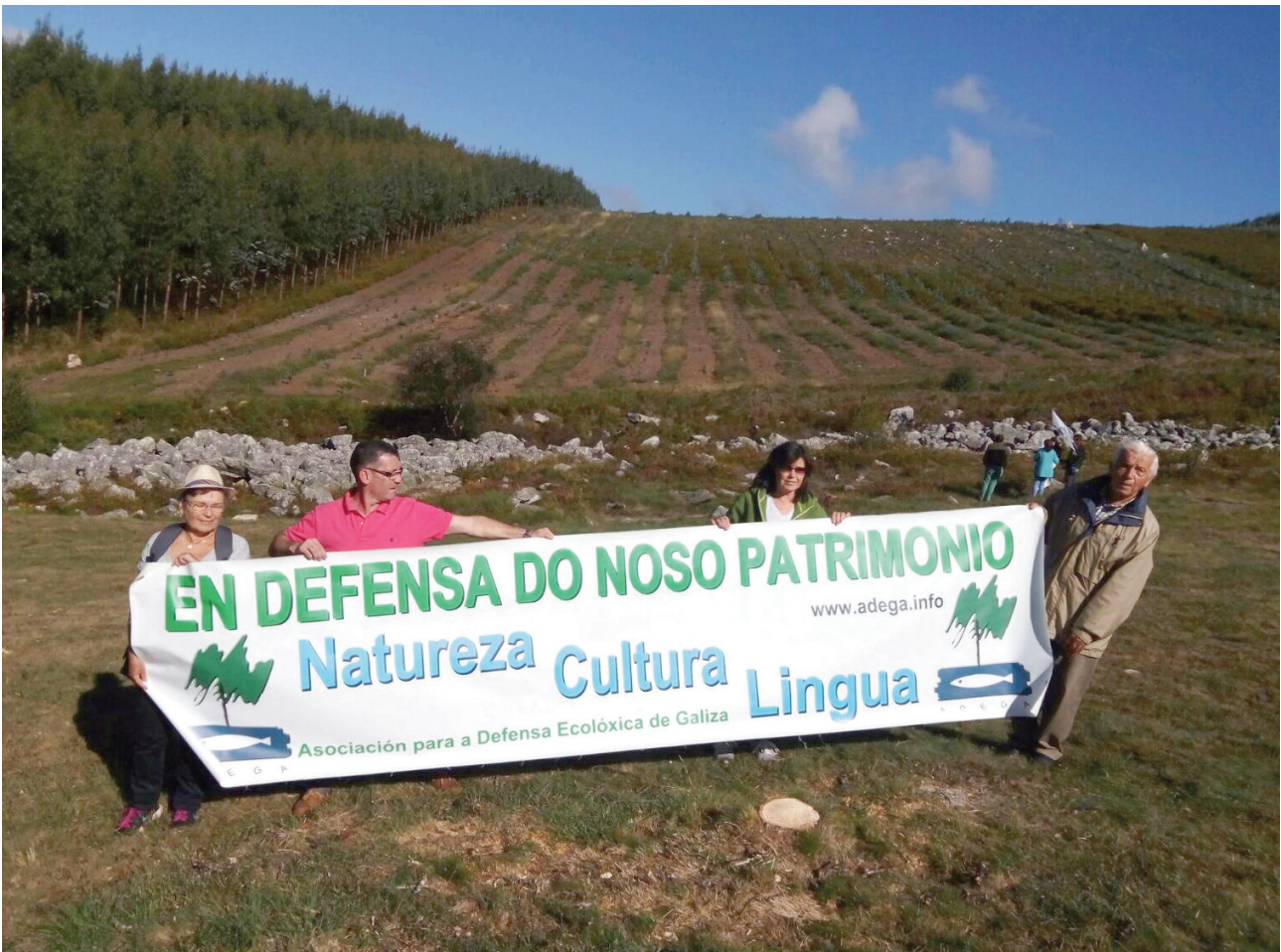
Ao fondo, unha parcela dunhas 5 Ha plantada con eucalipto nitens a carón do Pedregal de Irimia que, tras a denuncia de ADEGA e legalizada pola Confederación Hidrográfica Miño-Sil.