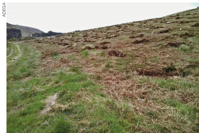
Plantación de eucaliptos a carón do Camiño Primitivo a Santiago (Palas de Rei) denunciada por ADEGA hai preto de 3 anos ante a Dirección Xeral de Patrimonio Cultural que, pese a ser sancionada, hoxe en día segue medrando.