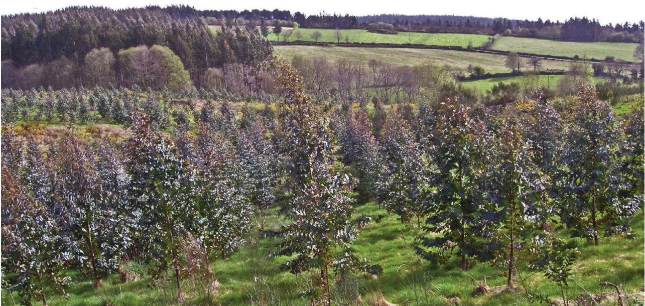
Plantación ilegal de eucaliptos nun prado de Friol denunciada por ADEGA-Lugo ante o Servizo de Montes da Consellaría de Medio Rural.