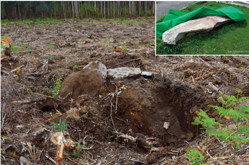
Mariña Patrimonio e ADEGA denunciaron a destrución do dolmen da Casa dos Mouros de Lobeira (Budián, O Valadouro). Unha das laxes derrubadas foi levada para o xardín dun particular (Imaxe de detalle. Fonte: Garda Civil).

risprudencia sobre o carácter invasor do eucalipto nitens, que aínda que non está incluído no Catálogo de especies invasoras do Estado, xa obtivo este recoñecemento oficial a través dos tribunais e nun ditame de 2012 do Comité Científico do propio Ministerio de Medio Ambiente.