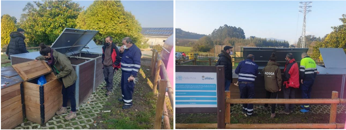
Imaxes correspondentes ao curso formativo ao persoal de mantemento do concello, na área de compostaxe comunitaria.