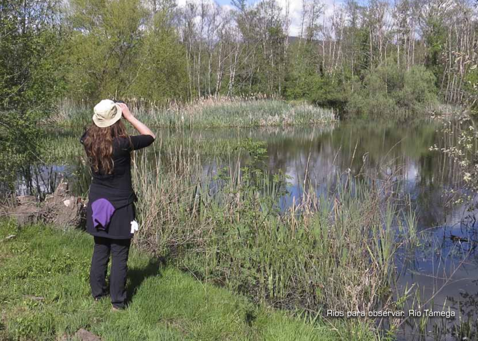
Ríos para observar: Río Tamega