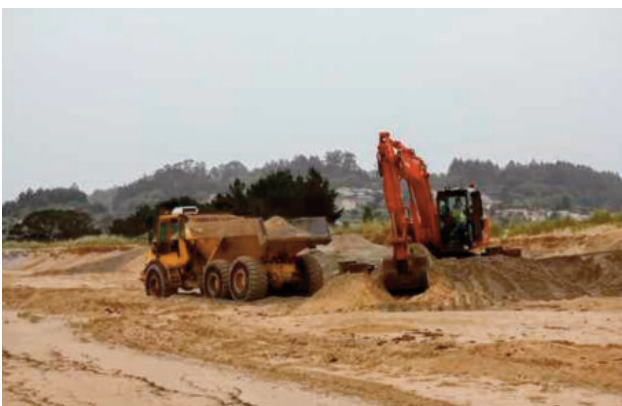
Os movementos de camiións e escavadoras pola area tamén provocan a morte de animais que habitan a zona seca da Praia.

Os graos de area dunha praia non son todos iguais, senón que adoitan ser de diversos tamaños, desde partículas de varios milímetros (grava) até outras inferiores a 0,063 mm (finos). Normalmente, o deitado de area adóitase facer cun grao de maior tamaño que o tamaño medio inicial da praia para evitar a erosión ao necesitar, deste xeito, máis enerxía de ondata para mover os graos e levalos fóra do sistema ou transportalos. A morfoloxía da praia e as comunidades que a habitan están directamente ligadas ao tamaño do grao de area, e a súa variación produce por si mesma unha modificación das condicións naturais da praia e da composición da súa comunidade.