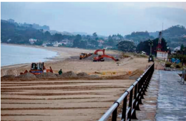
A mudanza morfolóxica da praia Grande de Miño, cuxo areal se viu este inverno gravemente afectado, é unha das máis evidentes dos últimos anos.