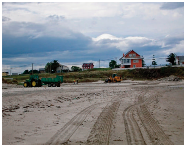
Recheo na praia de Arealonga de Barreiros.

A presión sobre a franxa costeira xunto coa construción nas proximidades ou mesmo enriba dos almacéns de area, das dunas, converten a dinámica das praias nun comportamento non natural, no que a perda de area non é compensada, por non existir reservas. Deste xeito, a praia pode chegar a perder moita da súa potencia, erosionándose até chegar ao substrato rochoso. Isto ten sucedido, e sucede, en praias máis ou menos naturais nas que non existen reservas de area e a pesar diso acaban por rexenerarse en máis ou menos tempo (dependendo das condicións