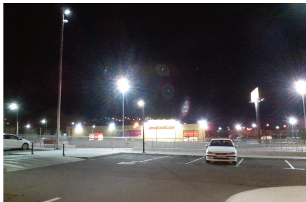
Espazo urbano sobreiluminado na bisbarra da Coruña.

As asociacións de afeccionados e afeccionadas á astronomía en Galiza son particularmente activas na divulgación e na loita contra este problema. Mención especial merece o inxente traballo desenvolvido pola Agrupación Astronómica 'Ío' da Coruña (3) . Froito dese traballo, o Parlamento de Galiza aprobou o 29 de setembro de 2015 unha Declaración Institucional en Defensa do Ceo Nocturno co apoio de todos os grupos parlamentarios (4) . Galiza aínda non conta con lexislación específica propia sobre esta materia, e polo tanto depende de normas estatais en moitas ocasións inadecuadas. Porén, esta declaración permite albergar certas esperanzas sobre a viabilidade dunha futura regulación que impida o deterioro do noso medio nocturno.