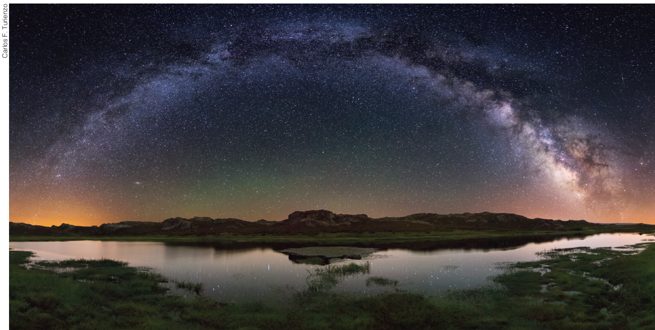
Un ceo sen contaminación luminica. “Vía Láctea sobre a Lagoa das Tabiillas” fotografía finalista no sony worldphotography awards 2016 , un dos máis respetados premios de fotografía do mundo. O Camiño das Estrelas. Vista nocturna dende as Lagoas Glaciares de Trevinca.

En Galiza temos un interesante nivel de actividade no que atinxe á investigación, divulgación e loita contra as causas e consecuencias da contaminación luminosa. Nas tres universidades galegas hai científicas e científicos preocupados por este fenómeno. A Universidade de Santiago de Compostela conta cun laboratorio específico de investigación sobre este problema e, en estreita colaboración con MeteoGalicia, ten despregada unha das principais redes para a medida e seguimento do brillo artificial do ceo nocturno que existen no mundo. Os seus datos forman parte da in-