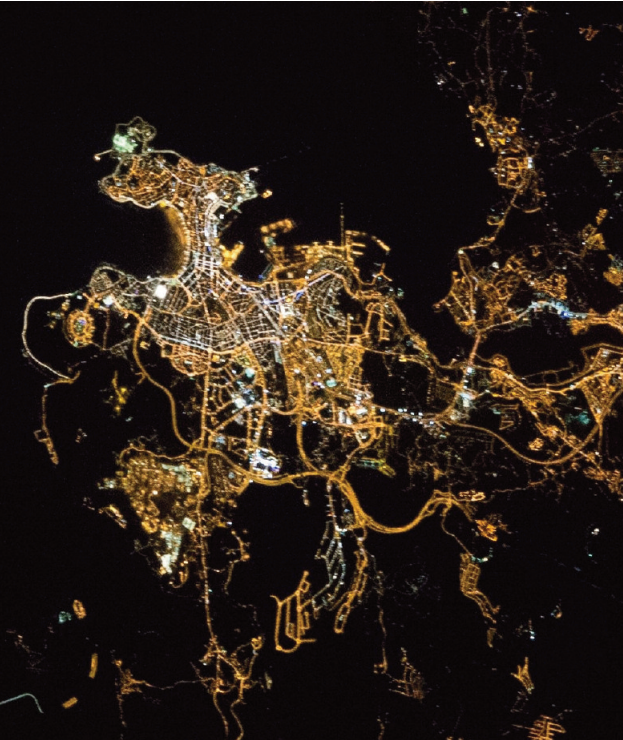
A Coruña, fotografada pola tripulación da Estación Espacial Internacional, na noite do 5 de decembro de 2015 (NASA ISS045-E-161487).

(LED) abren a posibilidade de realizar doadamente os axustes necesarios. Cos LED é sinxelo enviar luz de forma precisa a onde se necesita, evitando vertidos ao medio circundante. É tamén sinxelo programar a súa intensidade en función do momento da noite, e mesmo, combinándoos adecuadamente, controlar a súa distribución espectral. En condicións adecuadas permiten incluso aforrar algo de enerxía.