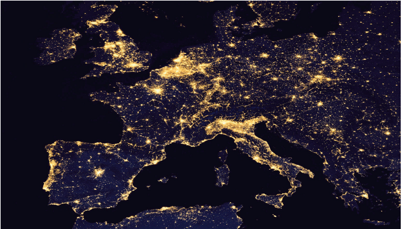
Emisións de luz cara ao ceo en Europa. Earth at Night 2012, SUOMI-NPP VIIRS via NASA Earth Observatory. http://npp.gsfc.nasa.gov/

A noite, a escuridade da noite, é unha necesidade fundamental para a vida na Terra. Cada vez é máis frecuente atoparmos gran cantidade de luz en horas nocturnas en lugares que non deberían ser iluminados, con efectos disruptivos directos sobre os organismos, poboacións e ecosistemas. O mal uso da iluminación artificial acaba cun importante elemento do patrimonio inmaterial da humanidade: o ceo estrelado. Para darlle a volta a esta situación precisamos facer un uso intelixente e sostible da luz, respectuoso coa natureza e coas persoas, e mesmo revisarmos a forma de usar novas tecnoloxías como o LED.