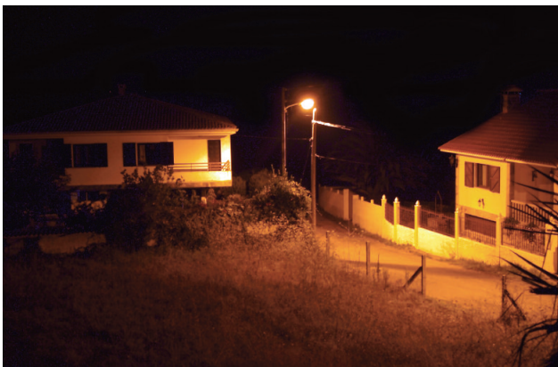
Espazo con escaso ou nulo tráfico rodado e peonil, iluminado toda a noite, na ría de Arousa.

formación medioambiental que pode ser consultada en tempo real na web da axencia meteorolóxica galega por parte de calquera persoa interesada (2) .