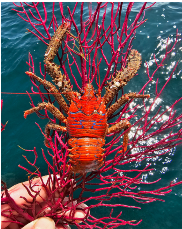
Galatea na costa galega · Rogelio Santos Queiruga

Galatea era a deusa que coidaba dos mariños e mariñas. É tamén o nome duns crustáceos das nosas costas. Os mariños e mariñas de hoxe en día encoméndanse á virxe do Carme. No mar, a forza da crenza ante as incertezas pode ser fundamental para saír adiante, de temporais ou de épocas duras. Con todo, o certo é que vivimos en tempos de fe escasa. Os vellos deuses caeron no esquecemento e os novos preséntanse como manifestacións culturais e do sentimento máis que como algo que poida influír nas nosas vidas. A que nos aferraremos os mariñeiros e mariñeiras actuais ante os problemas, tormentas e desafíos que temos por diante, e máis aínda, cos coñecementos actuais? Hoxe en día sabemos das forzas que desencadean as tormentas, que non son Eolo, Poseidón ou os pecados cometidos.