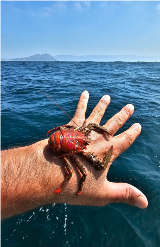
Galatea na costa galega · Rogelio Santos Queiruga

Nunca vin unha serea, pero si vin como na escuridade da noite ou nos días de néboa, as imaxes, os silencios e os sons poden facernos pensar que estamos seguros, ou o contrario. Non sei que é peor, se ver a morte ou non vela. Os cantos de serea poden atraer navegantes a un destino nefasto para un mesmo, pero interesado para quen os entoan. É necesario, coma no caso dos navegantes antigos, pechar os ouvidos para atopar o camiño seguro, facendo caso ao coñecemento, extremando os sentidos e a alerta.