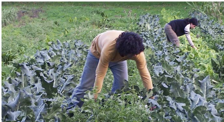
Cultivos de brócoli e acelga en agricultura ecolóxica.

En definitiva, o labrego tradicional limiao, como os do resto de Galiza, sabían aproveitar ao máximo a vocación de cada solo sacando o mellor rendemento co mínimo esforzo.