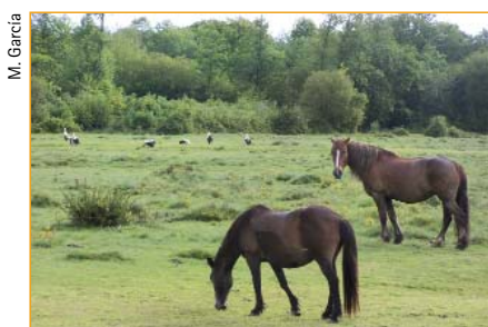
Cabalos pastando nas veigas da Sainza.