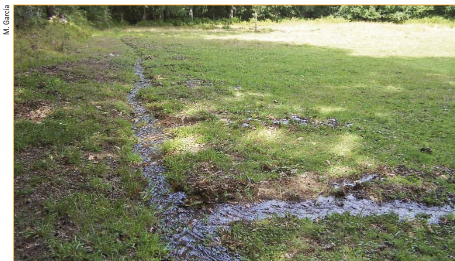
Sistema de regadío tradicional nos prados.

Despois das prazas e xa en terreos moi húmidos, atopámonos coas zonas de prados, sempre enmarcados por sebes de carballos, vidos, amieiros, freixos, ence-