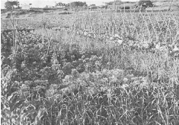
"A agricultura ecolóxica alternativa non se pode apoiar nun modelo de mera substitución de insumos"

noloxías. Do que si se trata é de que estas tecnoloxías se adecúen ao contexto no que se usan, algo que @s forof@s da agricultura industrial nin sequera son capaces de imaxinar. Pola outra banda, non por privilexiar o uso dos recursos propios se negan os intercambios con recursos alleos, sempre e cando o noso uso non comprometa a reprodución do recurso alleo, e viceversa. Na escala planetaria, iso explícase por dúas razóns: a) ao potenciar os recursos propios, redúcese a demanda de produtos alleos, e polo tanto a extracción e cultivo (en condicións de explotación obreira) de materias primas con prácticas altamente degradativas; e b) ao permitir en consecuencia ás periferias adicar os seus recursos para si, acadarán este requisito indispensable para que poidan saír desta condición de periferia. Por exemplo, a redución da demanda planetaria de fosfatos podería conducir á redución do interese de Marrocos para cos territorios da República Saharauí, non si?