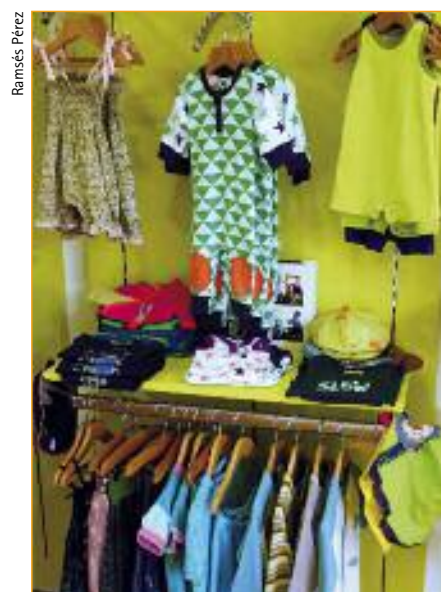
Mercar en comercios de barrio, talleres artesanais ou en tendas de comercio xusto ou ecolóxicas contribúe a favorecer a economía local ou de pequena escala.