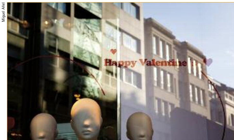
Os mercados que priman a cantidade das prendas sobre a calidade non son sostíbeis.

ademais de encher as augas residuais de fosfatos e outros ingredientes nocivos para o medio ambiente, fai que a roupa quede máis seca e áspera. Deste xeito, é case obrigado usar un suavizante para que a roupa fiquen mol. Empregando a dose xusta e optando por deterxentes ecolóxicos poderemos prescindir do suavizante con toda tranquilidade. O uso da secadora pode ser preciso nalgúns ocasións, pero está demostrado que estraga máis as fibras, sen contar o gasto enerxético que supón. O secado que mellor lle senta á roupa é o tendido ao aire