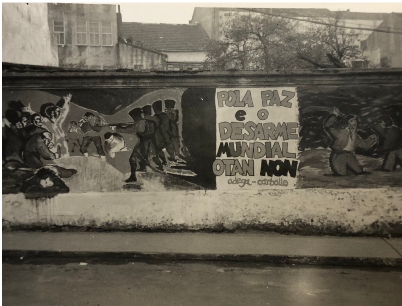
Mural de ADEGA en Carballo: «Pola paz e o desarme mundial. OTAN non». Mural pacifista contra a OTAN da delegación de ADEGA en Carballo. Franquean a mensaxe a reprodución de dúas pinturas de Goya: Os fusilamentos do tres de maio (1814) e Duelo a garrotazos (1820). As dúas pinturas evocan a violencia con crudeza, tanto a organizada (exército) como a interpersonal

A Coruña e Santiago de Compostela foron fundamentais para a organización nestes primeiros anos: a maioría das xuntanzas realizábanse nunha das dúas cidades e tamén a maioría das persoas socias indicaban como lugar de residencia A Coruña. Teñen un lugar destacado as outras urbes galegas e tamén se formaron delegacións en vilas do eixe atlántico e noutros puntos da xeografía galega. A asociación expandiuse para lograr unha capacidade de acción a escala galega, nun proxecto que se desenvolveu de xeito lento e laborioso ao longo dos anos 70 e 80.