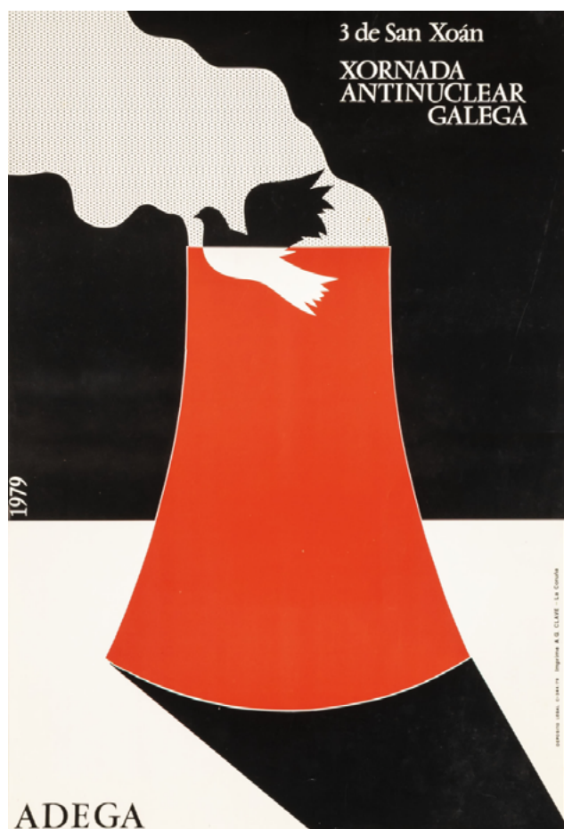
Cartaces sobre xornada antinuclear galega organizada por ADEGA no ano 1979