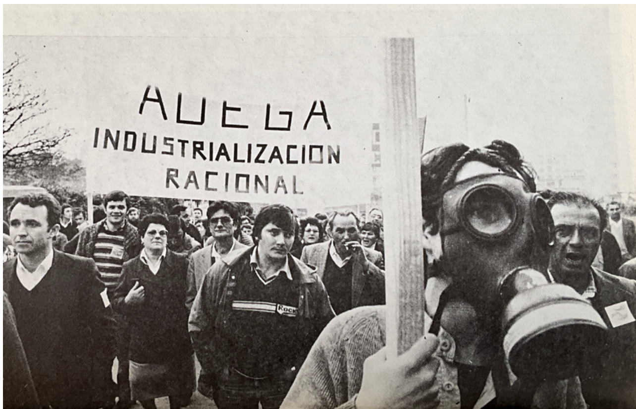
Mobilización por unha industrialización racional no ano 1988 · ADEGA. (1988). Celulosas e progreso. Concello de Fene

A fundación de ADEGA en 1974 produciuse nun contexto de crecente preocupación polas consecuencias da industrialización, a contaminación e a proliferación de centrais nucleares. Persoas de toda Galiza decidiron organizarse e poñer ao servizo da defensa do medio ambiente os seus coñecementos e capacidades. Participaron en loitas ambientais claves no movemento ecoloxista galego, algunhas delas aínda tan presentes como necesarias. Neste texto repasamos a súa historia ás portas da celebración dos seus 50 anos.