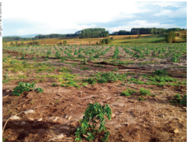
O hábitat de especies propias de áreas abertas, como a tartaraña cincenta, está a ser intensamente alterado por plantacións forestais.