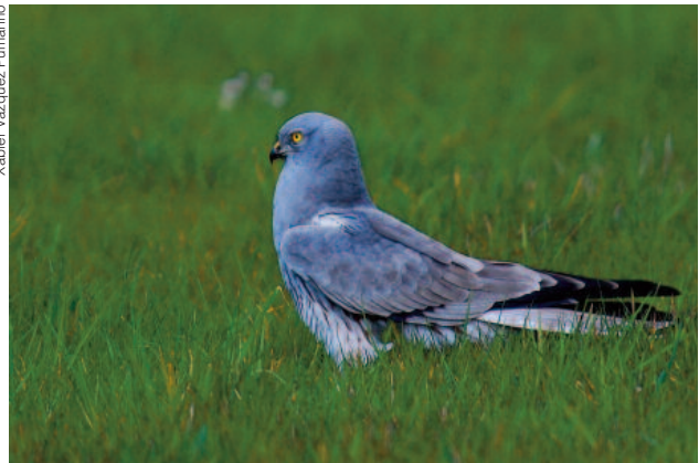
Macho de tartaraña cincenta.

que teñen como consecuencia o abandono da nidificación de especies como o voitre branco ou a aguia real.