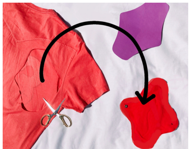
Creación dunha comprestela · Proxecto Xerminando

E é que a pesar de estarmos rescatando as compresas de tea usadas antigamente, o certo é que a nosa xeración creceu sen contacto ningún con esa opción, necesaria para recuperar unha maior soberanía sobre as nosas formas de vida máis sustentables e sobre a xestión da