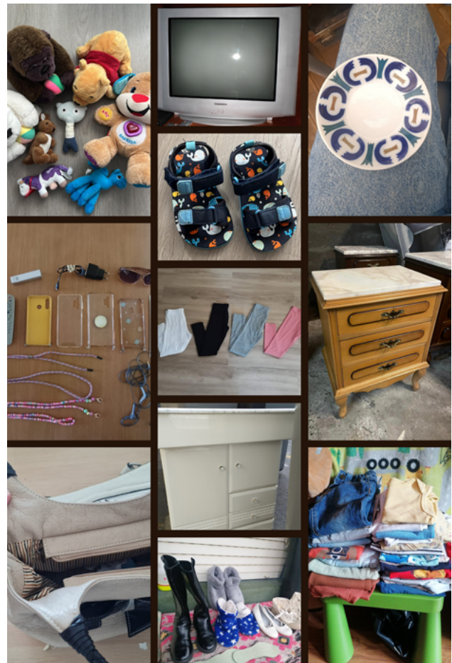
Mostra de obxectos que se procuran reaproveitar a través de Lixo de Luxo · Facebook Lixo de Luxo