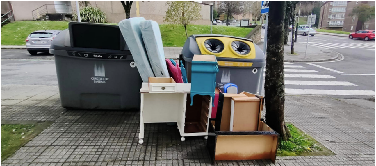
Mobles ao lado dun colector en Compostela · Lixo de Luxo

Da man das redes sociais e das formas de comunicación propias dos tempos da inmediatez, coámonos na comunidade de Compostela coa nosa proposta Lixo de luxo, unha iniciativa a prol da reutilización e de resistencia ao sistema capitalista, que depende do noso consumo, co obxectivo de facer as alternativas sustentables máis ao alcance do pobo.