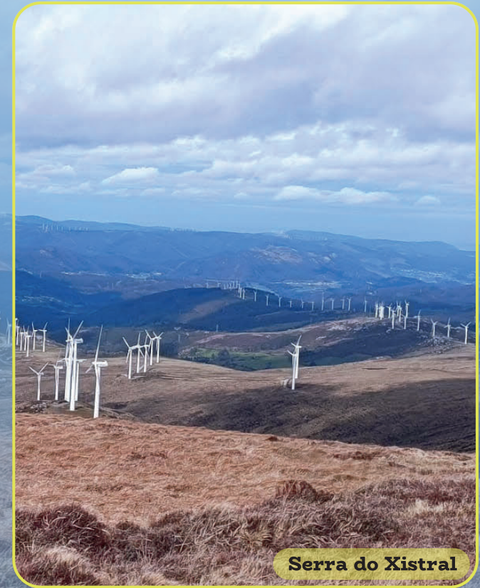
Serra do Xistral