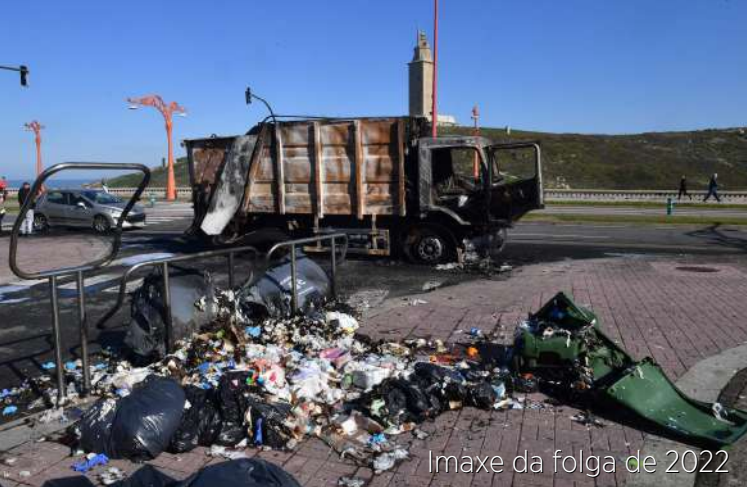
Imaxe da folga de 2022